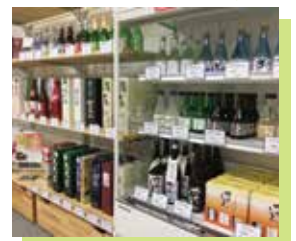
▲雪国マルシェ会員限定 ギャラリーショップ (JCV 東京情報センター内)