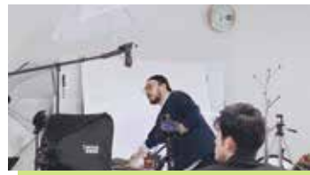
▲ワークショップ (商品撮影)