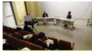
▲ビジネスセミナー