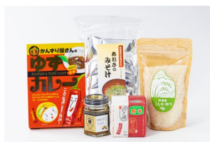
はじめましてセット