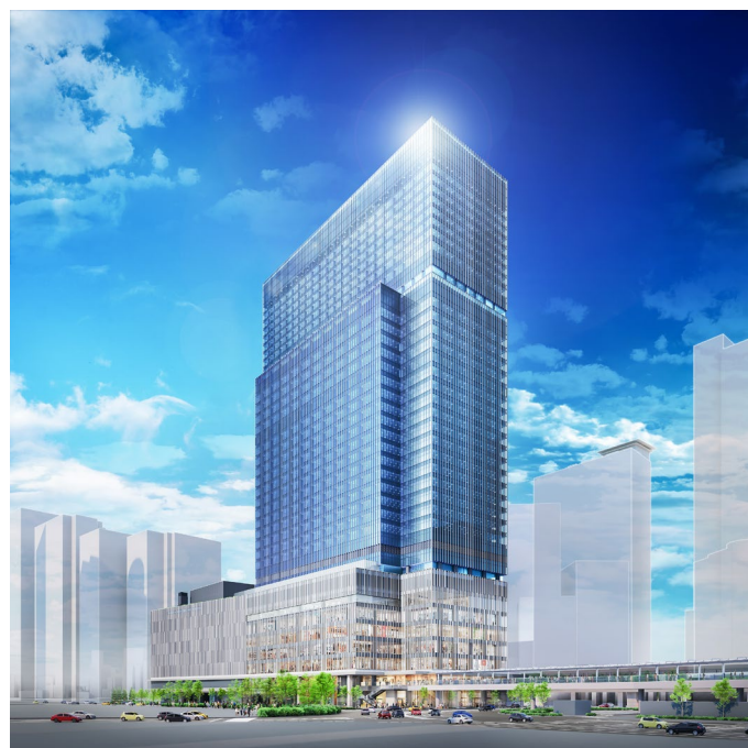
JPタワー大阪 建物外観イメージ