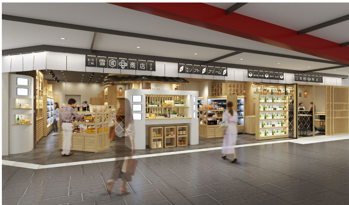
雪國商店®店舗イメージ